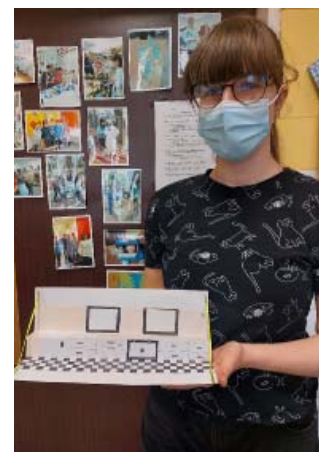
Pannónia Általános Iskola győztes csapata az elkészült konyhamodellel