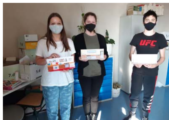
Életvitel verseny I. helyezés Móra Ferenc Általános Iskola