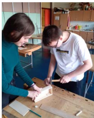
Zuglóban a Modellezés versenyen a Dr. Mező Ferenc Általános Iskola I. helyezést elért csapata